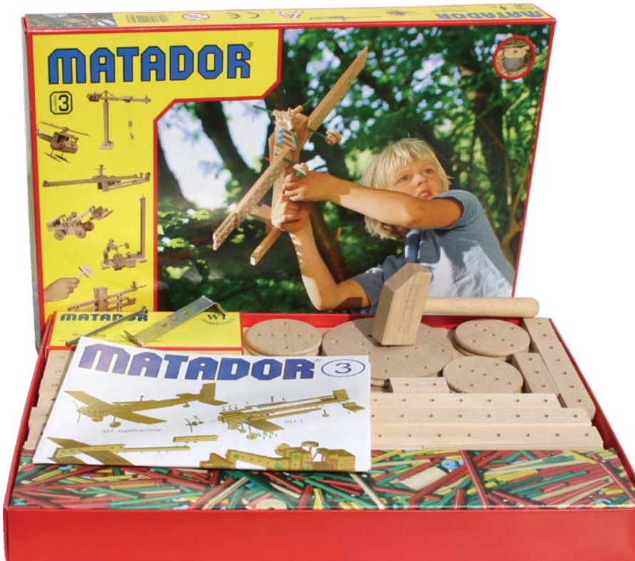
Der Matador-Baukasten Klassik 3 mit 410 Teilen, Werkzeug und Bauanleitung