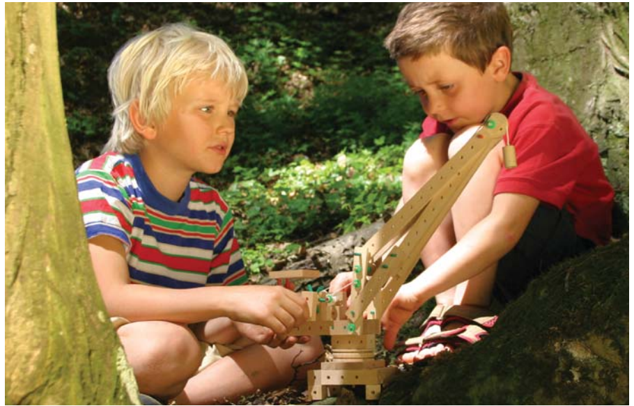
Hat Generationen elektronischen Spielzeugs überlebt: der Kran von Matador